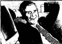
ফেইজার ২ পিসির মূল্য হ্রাস মুখে প্রধান অফিসেরকারী