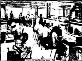
NET-র কমপিউটার প্রোগ্রাম

ছোদে প্রায় ১০০টি কমপিউটার এন আই আই টির যে কোন ছাত্রের ব্যবহারের জন্য সকাল ৬টা থেকে রাত