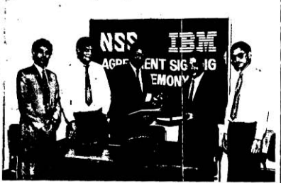
স'স'জ'তি আইসিএম, ন্যাশনাল সিস্টেম সলিউশনকে (এনএসএস) আইসিএম-এর 'NSSF' কম্পিউটারের বাংলাদেশে অধরাইজন্ড ফিলার নিয়োগ করেছে। ছবিতে ডক্টর কাকরার পর আইসিএম-এর ব্রুক ম্যানেলজার জনম স'স'জ'তি হোসেন, এনএসএস-এর ব্যবস্থাপনা পরিচালক জনাব পু'স'জ'তি ই'স'স'জ'তি আইসিএম-এর সাহায্যকারী ম'স'জ'তি বীর প্রতীক ও নাজিরুল ইসলাম এবং এনএসএস-এর ম'স'জ'তি ম'স'জ'তি স'স'জ'তি স'স'জ'তি।

স'স'জ'তি চাকর নি সুপরিচর ইলেক্ট্রনিক্স থেকে অভিনব কাণ্ডের চারটে হার্ডডিস্ক চুরি হয়েছে। জানা যাবে ২০-৩-৯২ তারিখে মেলিকানে অর্ডার দেয়ার পর জামাল ব্যক্তিগত নামে একজন লোক একটী প্রতিক্রিত কম্পিউটার প্রকিউরার কার্ড হাতে সুপরিচর ইলেক্ট্রনিক্সে আসেন। সেখান থেকে ৪টি হার্ডডিস্ক নিয়ে সুপরিচর ইলেক্ট্রনিক্সের একজন লোককে সেই কম্পিউটার প্রকিউরার হাণ্ডেলার পক্ষে কবিত জামাল ব্যক্তিগত হার্ডডিস্ক'স'স'জ'তি উত্তোলন হয়ে যায়। প্রকিউরারী এ ব্যাপারে কিছু জানেন না বলে জানান। পরে ২৪/৩/৯২ তারিখে সুপরিচর ইলেক্ট্রনিক্স কবিত জামাল ব্যক্তিগত একে প্রকিউরারীর বিরুদ্ধে গানমতি থানায়ে মান্দা পাঠবে করেন। এ ধরনের অভিনব উপায়ে গতে কতকদিনে আসবে বেশ কতকটা কম্পিউটার প্রকিউরার থেকে মালমালান আত্মরক্ষা করা হয়েছে বলে জানা গতে।