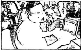
ভারতের অর্থনীতি পি. চিদাম্বরম একসঙ্গে নোট বুক পিসি ব্যবহার করছেন।

দেশের স্কুল, কলেজ, ক্রানিশিপি হার্ড-ড্রাইভ, শিক্ষক-বিজ্ঞান-মহাবলক-শেখাজিজিদের জ্ঞান-চাফিহ মেয়েট-