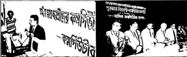
কমপিউটার জগৎ আয়োজিত গ্রামীয় কমপিউটার পরিচিতির প্রথম অনুষ্ঠানে (ডেসে. '৯২) দেশের প্রথম কমপিউটার প্রতিযোগিতার পুরস্কার বিতরণী অনুষ্ঠানে (ডিসেম্বর '৯২)