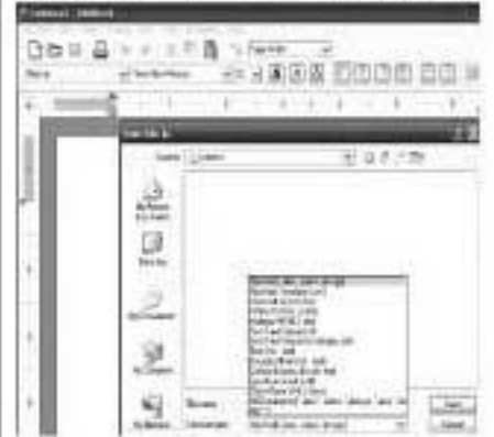
এবিওয়ার্ডে সেত এন অংশন

ধাপ-৮ : তিনটি ড্রপডাউন মেনুর ডান দিকে বেশ কয়েকটি বাটন রয়েছে, যা প্রয়োগ করে টেক্সটের বহিষ্করণ। এটি আপাত দৃষ্টিতে পরিবর্তন করতে পারে— যেমন বোল্ড, ইটালিক, আন্ডারলাইন ইত্যাদি অথবা স্বয়ংক্রিয়ভাবে বুলেট পয়েন্ট, যা প্রতি লাইনের শুরুতে লাইনের নাম্বার বসাতে সক্ষম। অবশিষ্ট বাটনগুলো প্রয়োগ করে