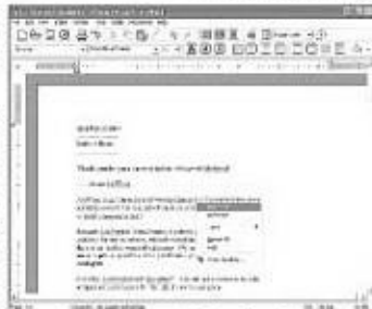
প্রথম মেয়ুরাসম্বর এবিওয়ার্ড

ধাপ-৪ : এবিওয়ার্ড ইনস্টল হবার পর প্রোগ্রামটি রান করুন। যখন এবিওয়ার্ড চালু হয়, তখন পর্যায়ক্রমিকভাবে লোড করে স্যাম্পল ফাইল। এতে থাকে এ প্রোগ্রামের রিগিল ডেট সম্পর্কিত একটি নোট। এবিওয়ার্ড বন্ধ করার জন্য উপরে