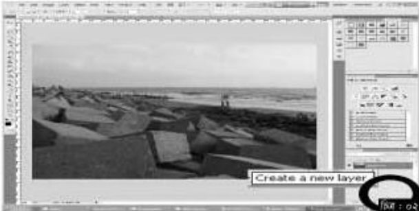
চিত্র : ০২

একটি Frame layer তুলুন। এটি করতে লেয়ার Panel-এর নিচে থেকে New layer তুলুন এবং এটিকে নিম্নে করে ফ্রেম করে দিন। এটির Criteria box থেকে Difference সিলেক্ট করে দিন। এবার মূল ছবিতে এবং Frame layer-এ Layer mask সংযোগ করুন। এটি করতে লেয়ার প্যানেলের নিচে একটি পতাকার মতো আইকনে ক্লিক করুন। এবার কাজ করার জন্য পুরোপুরি প্রস্তুত। লক রাখবেন, মূল ছবিতে কোনো কাজ করা চিক হবে না। সব সময় ডুপি-কেট লেয়ার তৈরি করে কাজ করা ভালো। লেয়ারটি সিলেক্টেড অবস্থায় Ctrl+M চাপলে কার্ভের প্যানেলটি সামনে আসবে। Curve একটি ছবির Red, Green এবং Blue এই তিনটি চ্যানেলকে বেজ করে ছবির টোন নির্ধারণ করে। এবার এই কার্ভকে কাজে লাগিয়ে ছবিটিকে খুব কড়া কন্ট্রাস্টে ছবিতে রূপান্তর করতে হবে। এখানে Input ১৩৩ এবং Output মাত্র ৩৭-এ রাখা হয়েছে। এবার লেয়ারগুড়ে ২ পিঙ্কেল Gaussian Blur প্রয়োগ করুন। এজন্য Filter → Blur → Gaussian Blur-এ ক্লিক করুন। ব-বের কারণে ▶