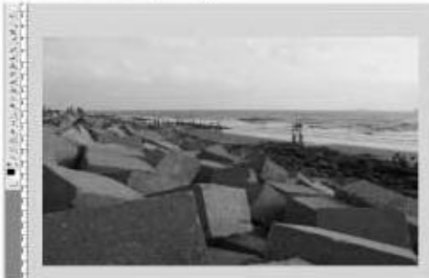
চিত্র : ০১

ফ্রেম তৈরি করার জন্য প্রথমেই ভালো রেজুলেশনের একটি ছবি নির্বাচন করতে হবে যার। একেদে মনে রাখতে হবে, খুব বেশি নয়জ্ঞ আছে এমন ছবি নির্বাচন না করাই ভালো হবে। কারণ অনেক সময়েই দেখা গেছে, একটি নয়েজ থাকা ছবি বা হাই আইএসও-এ তোলা ছবিতে ফ্রেম দিলে তা ভালো লাগার বদলে আরো খারাপ লাগে ও ছবির সৌন্দর্যহীন হয়। আর কাজ করার সুবিধার্থে এমনি একটি ছবি বেছে নিতে হবে যেখানে অনেক দূর পর্যন্ত মোশা মাঠ দেখা