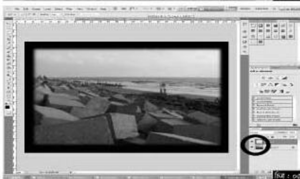
চিত্র : ০৫

কমিয়ে দেখার জন্য বুসের ত্রিভুজটি ডান দিকে সরিয়ে দিন। এবার ড্রপডাউন থেকে সবুজ রং সিলেক্ট করুন। এর Output Levels-এর সাদা ত্রিভুজটি বাম দিকে নিয়ে আসুন, যা সবুজ রঙকে আরো গাঢ় করে তুলবে। তাই হালকা কিছু রং-এর টেক্সচারে পরিবর্তনে ভালো লাগবে। জলজ ভাব দেখাতে কিছুটা সবুজাভ আদতে হবে। এ কাজ করার প্রক্রিয়া আগের মতোই New Adjustment Layer নিয়ে শুরু করতে হবে, যার Criteria হবে Levels। এর পর মফিং করে Invert করতে হবে আগের নিয়মে। এবার ছবি