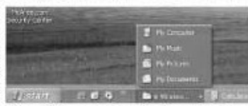
চিত্র-২ : মাস্কিপ ওপেন আইটেম ডেস্কটপে থাকা বাটন কলাপস করা

Explorer হচ্ছে প্রোগ্রামের নাম যা চারদিকে নেভিগেট করার এবং আপনার কম্পিউটারের সব ফোল্ডারের কনটেন্ট ডিউ করার সুযোগ দেয়।