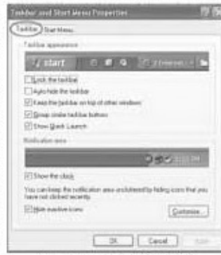
চিত্র-৩ : টাস্কবার আন্ড স্টার্ট মেনু প্রোপারটিজ

টাস্কবার বাটনে ক্লিক করলে তা উপস্থাপন করে ডেস্কটপের মাস্কিপ ওপেন আইটেম, যা একটি হোটি মেনু পপ করে, যা চিত্র-২-এ দেখানো