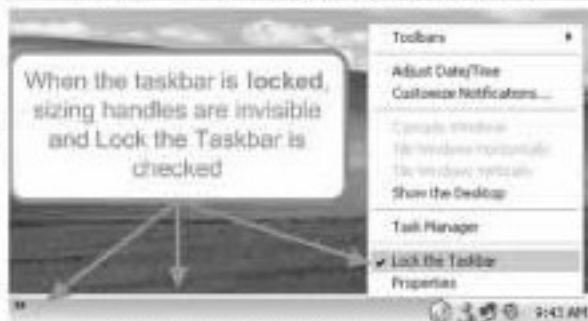
চিত্র-৫ : টাস্কবার লক থাকলে সাইজিং হ্যান্ডেল অদৃশ্য থাকবে

করতে পারবেন যেকোনো সময়। এজন্য নিচের দিকে ক্লিকে ডান গ্রাফের বর্তমান সময়ে ডান ক্লিক করে আবির্ভূত ক্লিক থেকে বেছে নিতে হবে Lock the Taskbar অপশন। আপনি জানতে