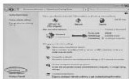
চিত্র-৪ : হোমগ্রুপে যুক্ত হওয়ার উইন্ডো