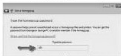
চিত্র-৫ : পাসওয়ার্ড এন্ট্রির উইন্ডো

কমপিউটার নিয়ে তৈরি করা যাবে যাদের অপারেটিং সিস্টেম উইন্ডোজ ৭।