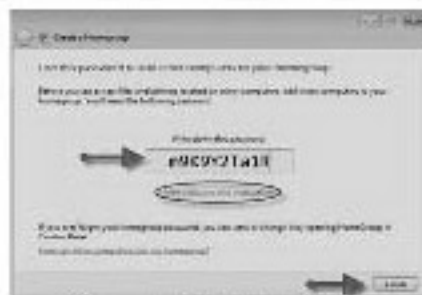
চিত্র-৩ : হোমগ্রুপের পাসওয়ার্ড উইন্ডো