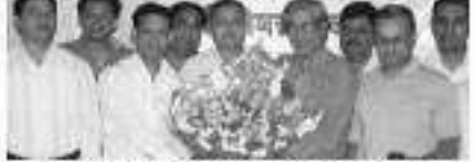
বিসিএস এর চট্টগ্রাম শাখা কারিগরি পটল

মোস্তাফা জব্বার বলেন, আমরা আশা করি নতুন কমিটি সততা ও নিষ্ঠার সাথে দায়িত্ব পালন করবে এবং নিজেদের স্বার্থ ত্যাগ করে জনগণের স্বার্থ রক্ষায় সচেষ্ট থাকবে।