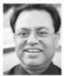
সৈয়দ আবুল হোসেন

সচিবের অন্য মন্ত্রণালয়ের দায়িত্ব দেয়া হয়। একে বিশ্বব্যাংক সন্তুষ্টি হওয়া না পারায় অবশেষে তাকে মন্ত্রিপরিষদ থেকে বিদায় করা হল। মাসারীপুর-১ সংসদীয় আসন থেকে নির্বাচিত সংসদ সদস্য সৈয়দ আবুল হোসেন মিলমী লীগ সরকারের ১৯৯৬-২০০১ মেয়াদে স্থানীয় সরকার প্রতিমন্ত্রীর দায়িত্ব পালন। তখন এক পাসপোর্ট কেলেঙ্কারির অভিযোগে তাকে মন্ত্রিপরিষদ থেকে বিদায় নিতে হয়। বর্তমান মহাজোট সরকার রাষ্ট্র ব্যত্যয় এলে আবুল হোসেন পালন করতেন মন্ত্রিপরিষদের দায়িত্ব। কিন্তু এবারো তিনি মন্ত্রিপরিষদে থাকতে পারলেন না। পলা সন্তুষ্টি প্রকল্পে দুর্নীতির অভিযোগে বিশেষ করে বিশ্বব্যাংকের চাপের মুখে তাকে শেষ পর্যন্ত কেলেঙ্কারি থেকে বিদায় নিতেই হল