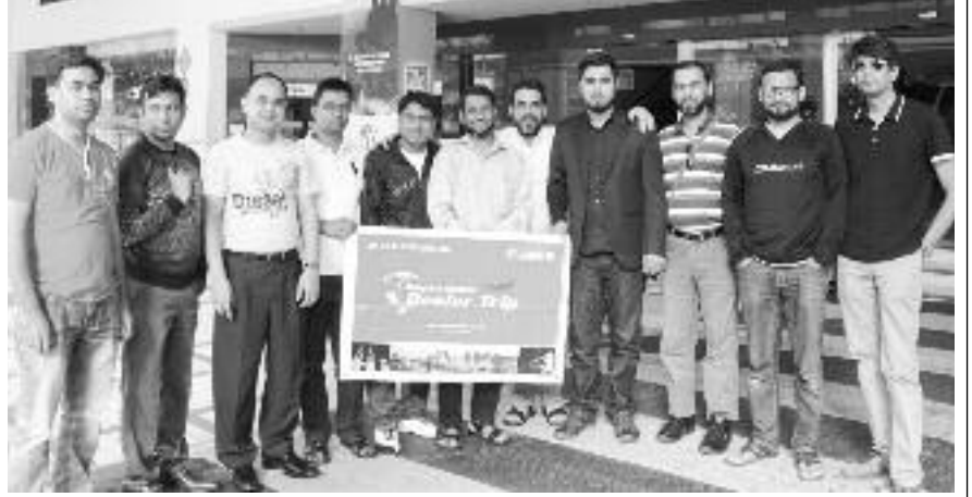
ক্যাননের পক্ষ থেকে মালয়েশিয়া ও সিঙ্গাপুর ভ্রমণকারীরা

সিঙ্গাপুরের আইসিটি সেক্টর নিয়ে বলতে গেলে বলতে হয়, এত ছোট একটি দ্বীপ রাষ্ট্রে পৃথিবীর প্রায় সব বড় প্রযুক্তি প্রতিষ্ঠানের বড় মাপের অফিস রয়েছে। যেমন— ক্যানন সিঙ্গাপুর প্রাইভেট লিমিটেডের অধীনে এশিয়ার প্রায় ১৫-১৬টি দেশের ক্যানন পণ্যের ব্যবসায় নিয়ন্ত্রণ