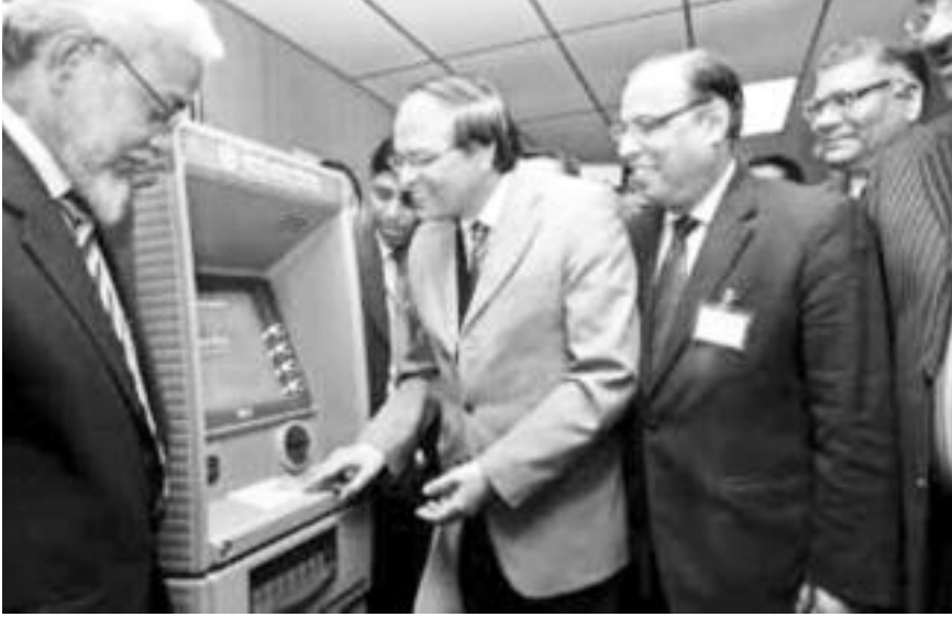
ন্যাশনাল পেমেন্ট সুইচ বাংলাদেশ উদ্বোধন করছেন বাংলাদেশ ব্যাংক গভর্নর ড. আতিউর রহমান