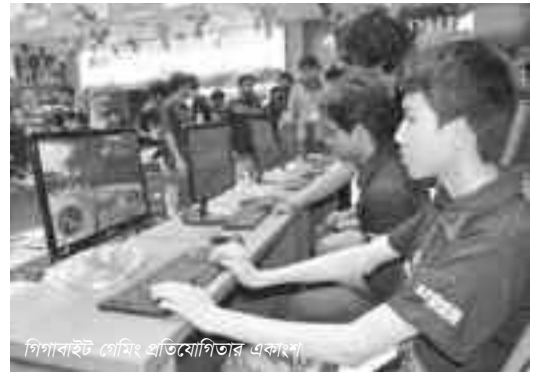
গিগাবাইট গেমিং প্রতিযোগিতার একাংশ

মেলা উপলক্ষে মনিটর ক্রয়ে মালদ্বীপ ভ্রমণের অফার দিয়েছিল কোরিয়ান আইটি কোম্পানি। স্ক্র্যাচ অ্যান্ড উইনে ট্রিপ টু মালদ্বীপ শীর্ষক অফারের সাথে আরও ছিল এলইডি টিভি, ল্যাপটপ ও মোবাইল ফোন জেতার সুযোগ।