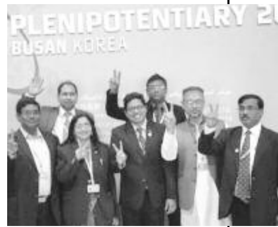
নির্বাচনে জয়ের পর বাংলাদেশ প্রতিনিধি দলের সাথে তথ্য ও যোগাযোগ প্রযুক্তি প্রতিমন্ত্রী জুনাইদ আহমেদ পলক

নির্বাচনে ১১৫ ভোট পেয়ে সপ্তম হয়েছে বাংলাদেশ। নির্বাচনটি অনুষ্ঠিত হয় কোরিয়ার বাণিজ্যিক শহর বুসানে। মোট ১৬৭টি সদস্য রাষ্ট্রের প্রতিনিধি ভোট দেন। এশিয়া ও ওশেনিয়া অঞ্চলের ১৩টি পদের জন্য বাংলাদেশের সাথে প্রতিদ্বন্দ্বিতা করে ১৮টি দেশ। ২০১০ সালে