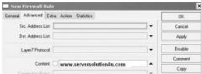
চিত্র-২ : কনটেন্ট ঘরে যে সাইট ব্লক করতে চান তা লেখা

০২. এবার নিউ ফায়ারওয়াল রুলের অ্যাডভান্সড ট্যাবে ক্লিক করুন। লেয়ার ৭ প্রটোকলের নিচে কনটেন্ট বক্সে সাইটের নাম দিন। অর্থাৎ যে সাইটটি ব্লক করতে চাচ্ছেন তার অ্যাড্রেস এখানে টাইপ করে অ্যাপ্লাই বাটনে ক্লিক করুন। অর্থাৎ Content-এর ঘরে www.serversolution4u.com টাইপ করে অ্যাপ্লাই বাটনে ক্লিক করুন।