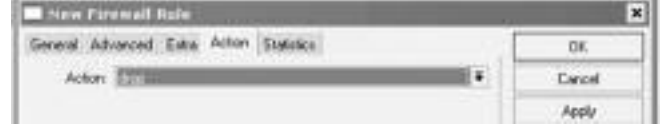
চিত্র-৩ : সাইট ব্লক করতে ড্রপ, আর চালু রাখতে অ্যাকসেন্ট সিলেক্ট করা

০৩. আপনার ফায়ারওয়াল রুল সেট হয়ে গেছে। এবার অ্যাকশন ট্যাবে ক্লিক করে Action-হিসেবে Drop সিলেক্ট করে অ্যাপ্লাই বাটনে ক্লিক করুন।