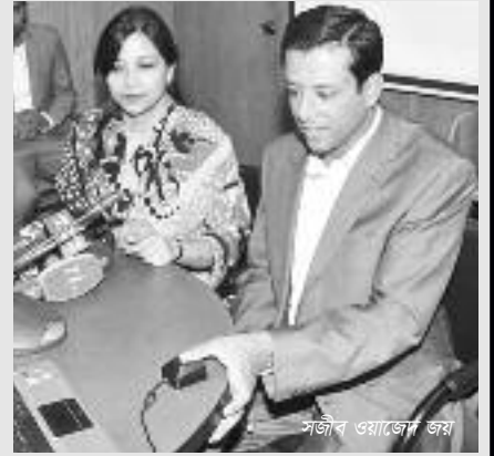
সজীব ওয়াজেদ জয়

মোবাইল ফোনের সিম নিবন্ধনে বায়োমেট্রিক বা আঙ্গুলের ছাপ পদ্ধতি ব্যবহার কার্যক্রমের উদ্বোধন করেছেন প্রধানমন্ত্রীর তথ্য ও যোগাযোগ প্রযুক্তি বিষয়ক উপদেষ্টা সজীব ওয়াজেদ জয়। সম্প্রতি সচিবালয়ে ডাক ও টেলিযোগাযোগ বিভাগে নিজের আঙ্গুলের ছাপ দিয়ে পরীক্ষামূলক এ কার্যক্রমের উদ্বোধন করেন তিনি। কার্যক্রম উদ্বোধনের ওই অনুষ্ঠানে জয়কে রাষ্ট্রীয় মোবাইল অপারেটর টেলিটকের পক্ষ থেকে একটি সিম দেয়া হয়। আঙ্গুলের ছাপ দিয়ে সিমটি নিজের নামে নিবন্ধন করেন তিনি। তিনি সিমের দাম বাবদ ১৮০ টাকা টেলিটকের ব্যবস্থাপনা পরিচালক