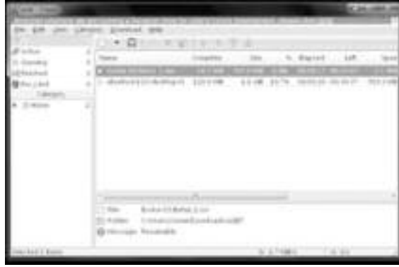
চিত্র-১ : ইউগেট ডাউনলোড ইন্টারফেস

ইউগেটের অন্যতম এক পছন্দনীয় ফিচার হলো ডাউনলোড ক্যাটাগরি তৈরি করার সক্ষমতা। একটি ক্যাটাগরির মাধ্যমে আপনি কিছু কনফিগারেশন অপশন সেট করতে পারবেন। সুতরাং, আপনাকে সবসময় আইএসও ইমেজ, মিউজিক, ভিডিও বা ডকুমেন্টের জন্য একটি নির্দিষ্ট ফোল্ডার সিলেক্ট করতে হবে না। ক্যাটাগরির জন্য ইউজার নেম, পাসওয়ার্ড সেট করতে হয়। অফচাসে রেগুলার ডাউনলোডের জন্য অথেন্টিকেশনের দরকার হয়।