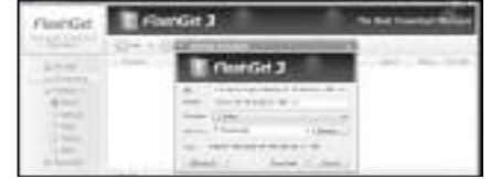
চিত্র-৫ : ফ্ল্যাশগেট ডাউনলোড ম্যানেজারের ইন্টারফেস

আপনার ডাউনলোড ম্যানেজমেন্টকে আরও অনেক বেশি দক্ষ করে তোলে, যদি আপনি ডাউনলোড স্পিডকে বাড়াতে চান, তাহলে ব্যাচ ডাউনলোড এ কাজটি সহজতর করে দেবে অথবা ব্রাউজারে ডাউনলোড ইন্টিগ্রেশন আরও বেশি ভালো হবে।