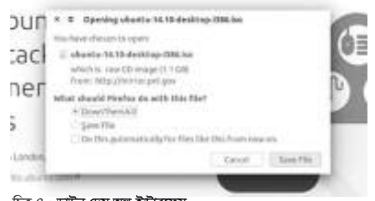
চিত্র-৪ : ডাউন দেম অল ইন্টারফেস

ফ্ল্যাশগেট ফিচার হলো উইন্ডোজ ক্লিপবোর্ডের সাথে এর ইন্টিগ্রেশন। যখনই আপনি ব্রাউজার থেকে একটি লিঙ্ক কপি করবেন, তখনই ফ্ল্যাশগেট ওপেন হবে, যাতে আপনি ডাউনলোড শুরু করতে পারেন ওই নির্দিষ্ট ফাইলটি। বিস্ময়করভাবে কিছুটা সেকেন্ডে ধরনের হলেও ব্যবহারকারীরা এটি বেছে নেন অনেক সময়। যদি আপনি সহজ ব্যবহারযোগ্য টুল খোঁজ করেন, যা