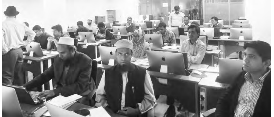
ওপেনসোর্সে নিয়া বাসের ডব্লিউএসএ প্রশিক্ষণ

BNEA সংক্রান্ত তথ্য, আইসিটি সেবা বা পণ্য কেনার ক্ষেত্রে অনুসরণীয় মানদণ্ড, মূল নীতিমালা, বিবরণী, জাতীয় সার্ভিস বাস সংক্রান্ত তথ্য, BNEA-এর বিভিন্ন উপাদানের আদর্শ নমুনা,