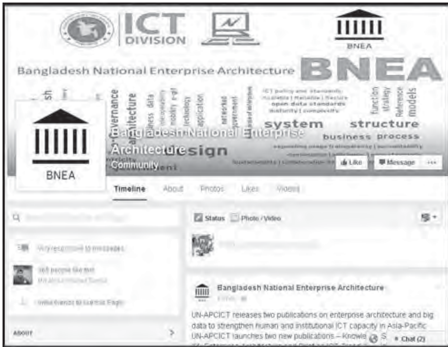
বিনিয়ার ফেসবুক পেজ www.facebook.com/bnea.bcc

বিভাগ, প্রাথমিক শিক্ষা অধিদফতর এবং খাদ্য অধিদফতর।