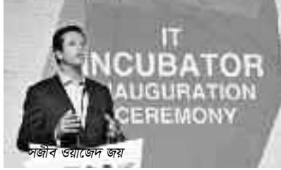
সজীব ওয়াজেদ জয়

হোটেলে আয়োজিত অনুষ্ঠানে প্রধান অতিথি ছিলেন প্রধানমন্ত্রীর তথ্য ও যোগাযোগ প্রযুক্তি উপদেষ্টা সজীব ওয়াজেদ জয়। তথ্যপ্রযুক্তি খাতে তরুণ উদ্যোক্তাদের নিয়ে সম্প্রতি আয়োজিত