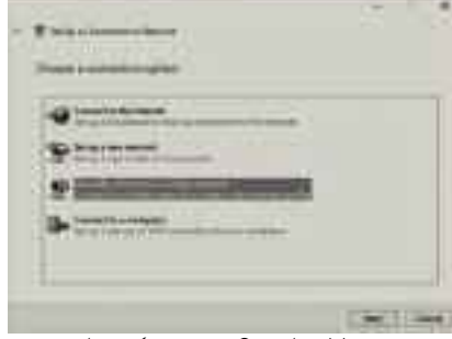
ওপেন নেটওয়ার্ক অ্যান্ড শেয়ারিং সেন্টার উইডোজ চালু করা