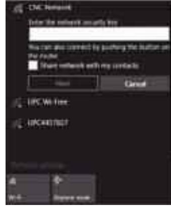
সংযোগের আগে নেটওয়ার্কের সিকিউরিটি কী এন্ট্রি দিতে হবে

ওপরে প্রদত্ত নির্দেশাবলী ঠিকমতো অনুসরণ করার পরও নেটওয়ার্ক সংযোগ সমস্যা হতে পারে। যদিও নিরাপত্তা তথ্য সঠিকভাবে প্রবেশ করিয়েছেন, তথাপি আপনার পছন্দের নেটওয়ার্কে সংযোগ স্থাপন করতে সমস্যা হতে পারে। নেটওয়ার্কিং সমস্যা সমাধানের জন্য একটি ধারাবাহিক ফ্লোচার্ট তৈরি