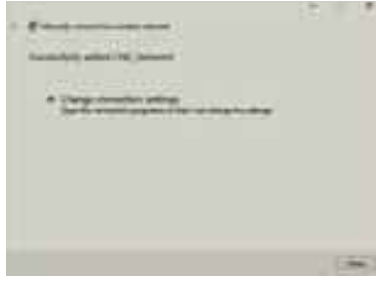
সফলভাবে লুকানো নেটওয়ার্কে যুক্ত হওয়ার বার্তা সংবলিত উইডোজ