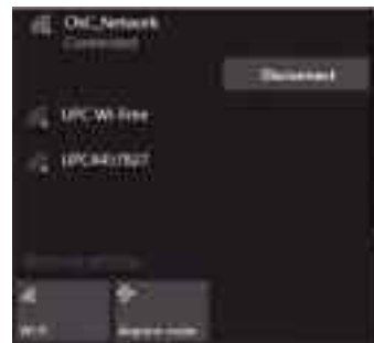
নেটওয়ার্ক থেকে বিচ্ছিন্ন হওয়া