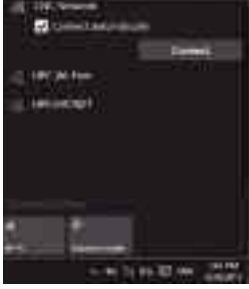
সিগন্যাল ব্রডকাস্ট করে এমন ওয়্যারলেস নেটওয়ার্কে যুক্ত হওয়া

একটি বেতার নেটওয়ার্ক যদি তার নাম এসএসআইডি ব্রডকাস্ট করে, তাহলে এটি তার সীমার মধ্যে কোনো উইডোজ ডিভাইস দিয়ে তালিকাভুক্ত করা হবে। উইডোজ ১০-এ তারবিহীন