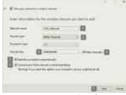
লুকানো বা প্রচ্ছন্ন ওয়্যারলেস নেটওয়ার্কে যুক্ত হওয়ার জন্য প্রয়োজনীয় তথ্য এন্ট্রি দেয়া হচ্ছে