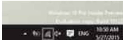
নেটওয়ার্কে যুক্ত হওয়ার পর টাস্কবারে ওয়্যারলেস আইকনে ওয়্যারলেস সংযোগ সংক্রান্ত সমস্যার সমাধান

দ্রুততম উপায় হচ্ছে সিস্টেম ট্রে থেকে নেটওয়ার্ক আইকনে ডান ক্লিক করা অথবা টোকা দেয়া এবং তারপর Open Network and Sharing Center নির্বাচন করা।