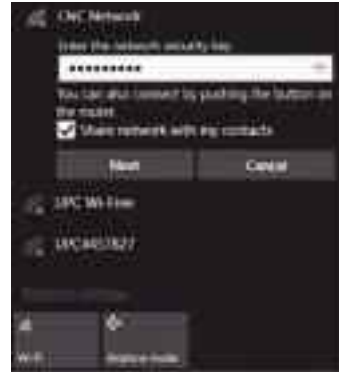
অন্যদের সাথে সংযুক্ত নেটওয়ার্ক শেয়ার করা হচ্ছে