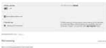
উইন্ডোজ ১০-এ অ্যাক্টিভিটি ট্র্যাকিং

অ্যাক্টিভিটি ট্র্যাকিং সক্রিয় করার জন্য চাইল্ড অ্যাকাউন্টের পাশে Check recent activity-এ ক্লিক করুন এবং Activity reporting-কে সক্রিয় করুন। এর ফলে জানতে পারবেন আপনার শিশু ইন্টারনেট এক্সপ্লোরারে বা এজ ব্রাউজারে কোন কোন ওয়েবসাইটে ভিজিট করেছিল। দেখতে পারবেন আপনার শিশু কোন অ্যাপস এবং গেম ব্যবহার করেছে, যখন সেগুলো লগইন হয় এবং আপনার সন্তান তাদের ডিভাইসের সাথে পার্সোনাল লগইন ব্যবহার করে কত সময় ব্যয় করেছে তা ট্র্যাক করতে পারবেন।