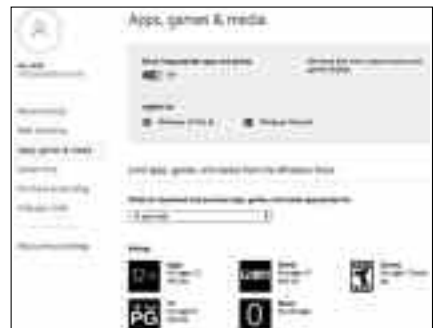
বেমানান অ্যাপস, গেমস ও মিডিয়া ব্লক করা

অ্যাপস, গেমস ও মিডিয়ায় অ্যাক্সেসকে সীমিত করার জন্য আপনার চাইল্ড অ্যাকাউন্টের পাশে More বাটনে ক্লিক করে Apps, games &