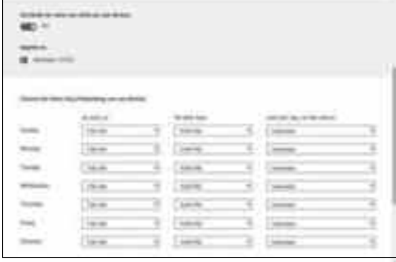
স্ক্রিন টাইম সেট করা