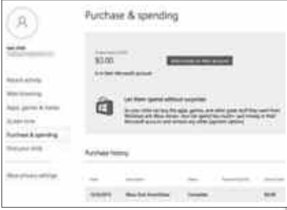
পারচেজ অ্যান্ড স্পেন্ডিং ফিচার