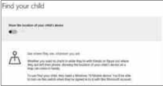
আপনার শিশুর ডিভাইসের লোকেশন দেখা

media-এ ক্লিক করুন এবং Block inappropriate apps and games অপশন সক্রিয় করুন। বাইডিফল্ট মাইক্রোসফট সব চাইল্ড অ্যাকাউন্ট থেকে প্রাপ্তবয়স্কদের মুক্তি এবং গেম ব্লক করে দেয়। তবে এ সেটিং আপনাকে সুযোগ দেবে অ্যাপস এবং গেমসকে বয়স (৩ থেকে ২০ বছর পর্যন্ত) অনুযায়ী সীমাবদ্ধ করতে। আপনি ইচ্ছে করলে সুনির্দিষ্ট অ্যাপস এবং গেমস ব্লক করে দিতে পারেন যথোচিত বয়স গুরুত্ব না দিয়ে।