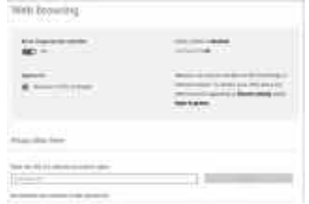
বেমানান ওয়েবসাইটগুলো ব্লক করা

আপনার শিশু যাতে বেমানান ওয়েবসাইটগুলো ভিউ করতে অথবা কনটেন্ট সার্চ করতে না পারে, সে জন্য ওয়েবসাইট ব্লকিং ফিচার সক্রিয় করুন তাদের অ্যাকাউন্টের পাশে More-এ ক্লিক করে। এবার Web browsing-এ ক্লিক করে Block inappropriate websites অপশনকে সক্রিয় করুন। এটি প্রাপ্তবয়স্কদের কনটেন্ট ব্লক করে এবং ইন্টারনেট এক্সপ্লোরার বা এজ ব্রাউজারে SafeSearch সক্রিয় করে।