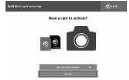
আইফি মোবি কার্ড সেটআপ প্রক্রিয়া

মোবির একমাত্র আকর্ষণীয় বৈশিষ্ট্য হচ্ছে তার গতি। তবে আপনি ডি-এসএলআর ক্যামেরায় বাস্ট (burst) মোড পছন্দ করলে মোবির ইমেজ রাইট করার গতিতে হতাশ হতে পারেন। দেখা যায় মোবি ২৬.৬ সেকেন্ড সময় নেয় একটি 11-shot Raw+JPG বাস্ট রেকর্ড করার জন্য, ২২.৩