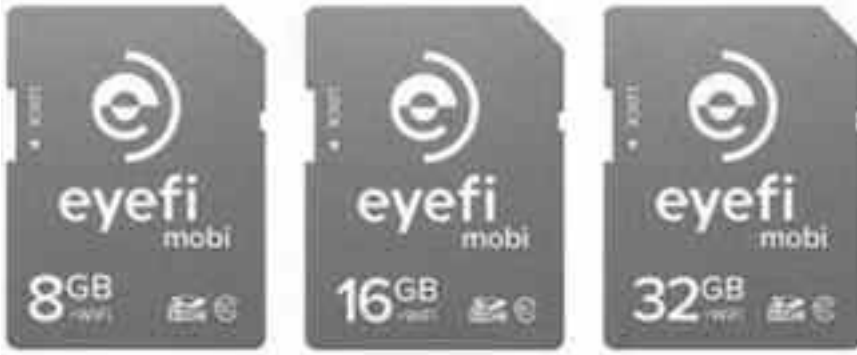
বিভিন্ন স্টোরেজ ক্যাপাসিটি সংবলিত আইফি মোবি মেমরি কার্ড

পারেন। অন্যান্য আইফি কার্ড যেমন প্রো X2-এ Raw ফরম্যাটের ছবি স্থানান্তর এবং অন্যান্য উন্নত ফাংশন সমর্থন করে। কিন্তু সেগুলোকে স্থাপনের জন্য কিছুটা সময় ব্যয় করতে হবে। আপনি যদি কার্ডের ফাংশন পরিবর্তন করতে চান, তাহলে কমপিউটারের সাহায্যে কার্ড পুনঃকনফিগার করতে হবে। মোবি আপনার ডিজিটাল ক্যামেরা থেকে ফটো ফোন ডিভাইসে হস্তান্তর করার বিষয়টি সত্যিকারেই সহজ করেছে।