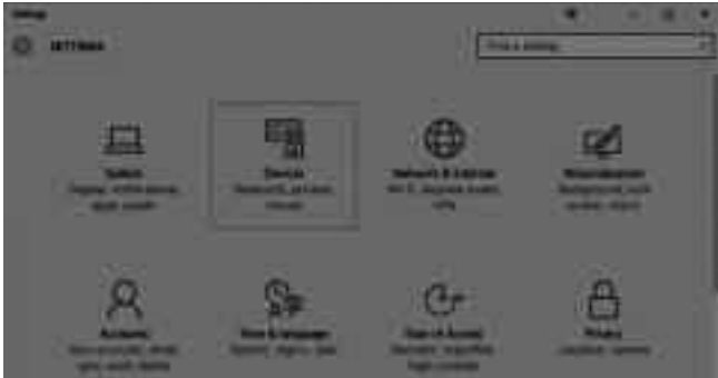
সেটিং থেকে ডিভাইস আইকন সিলেক্ট করা