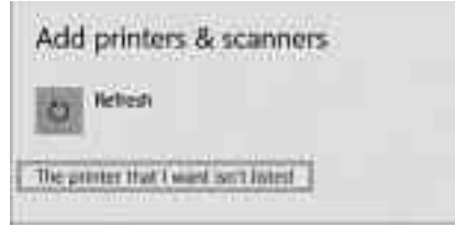
প্রিন্টার বা স্ক্যানার যোগ করার উইন্ডো