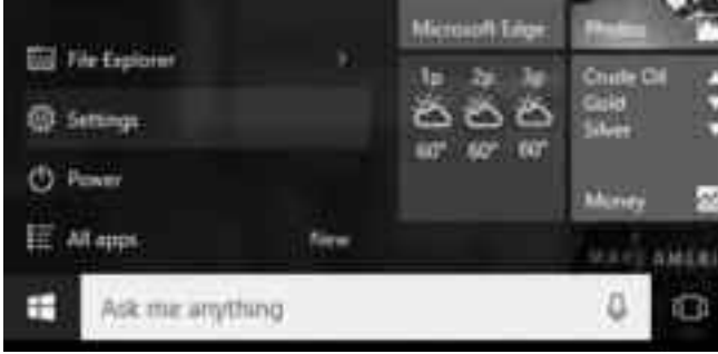
সেটিং অ্যাপস উইন্ডো