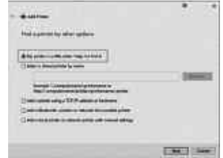
সিস্টেম থেকে প্রিন্টার খুঁজে বের করার বিভিন্ন অপশন

আপনি Settings → Devices-এর অধীনে Printers & scanners সেকশনে স্বয়ংক্রিয়ভাবে যুক্ত প্রিন্টার খুঁজে পাবেন। কোনো সমস্যা দেখা দিলে নিশ্চিত করুন প্রিন্টারটি তুলনামূলকভাবে আপনার কমপিউটারের কাছে স্থাপন করা হয়েছে এবং ওয়্যারলেস রাউটার থেকে খুব বেশি দূরে নয়। আপনার প্রিন্টারে যদি একটি ইথারনেট জ্যাক থাকে, তাহলে এটি সরাসরি আপনার রাউটারের সাথে সংযুক্ত করবেন এবং একটি ব্রাউজার ইন্টারফেসের সাহায্যে এর ব্যবস্থাপনা করবেন।