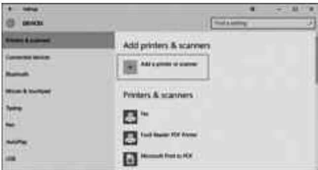
প্রিন্টার ও স্ক্যানার যোগ করার জন্য রয়েছে অভিন্ন অপশন