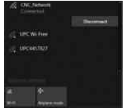
নেটওয়ার্ক থেকে বিচ্ছিন্ন হওয়া

নেটওয়ার্ক সংযোগ বিচ্ছিন্ন করার তালিকা থেকে নেটওয়ার্ক নাম খোঁজার মতোই সহজ। এটা করবেন 'Disconnect' নির্বাচন করে এবং পরে এতে ক্লিক করে অথবা টোকা দিয়ে।