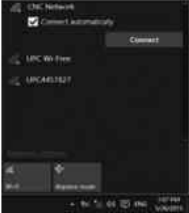
সিগন্যাল ব্রডকাস্ট করে এমন ওয়্যারলেস নেটওয়ার্কে যুক্ত হওয়া

একটি বেতার নেটওয়ার্ক যদি তার নাম, এসএসআইডি ব্রডকাস্ট করে, তাহলে এটি তার সীমার মধ্যে কোনো উইন্ডোজ ডিভাইস দিয়ে তালিকাভুক্ত করা হবে। উইন্ডোজ ১০-এ তারবিহীন নেটওয়ার্ক লভ্য তালিকা থেকে অ্যাক্সেস করতে হলে সিস্টেম ট্রে থেকে নেটওয়ার্ক আইকনে ক্লিক করুন অথবা টাচস্ক্রিনে টোকা দিন। যে নেটওয়ার্কে সংযুক্ত হতে চান, সেটি চিহ্নিত করে তার নামের ওপর ক্লিক করুন বা টোকা দিন। যদি আপনি জানেন, এই নির্বাচিত নেটওয়ার্কে নিয়মিতভাবে যুক্ত হবেন, তাহলে 'Connect automatically' অপশনটি সিলেক্ট করুন। এ পদ্ধতিতে যখনই আপনার ডিভাইস ওই নেটওয়ার্কের সীমার মধ্যে আসবে, তখন এটি স্বয়ংক্রিয়ভাবে এর সাথে সংযুক্ত হয়ে যাবে।