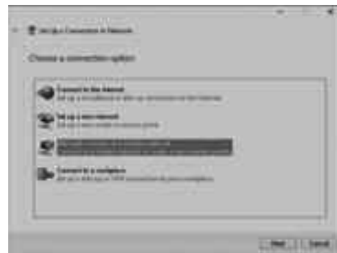
কানেকশন অপশন উইন্ডো

আপনার নেটওয়ার্কের জন্য প্রয়োজ্য নিরাপত্তা তথ্য যথাযথ ফিল্ডে বা ক্ষেত্রে নিম্নরূপভাবে প্রবেশ করাতে হবে-