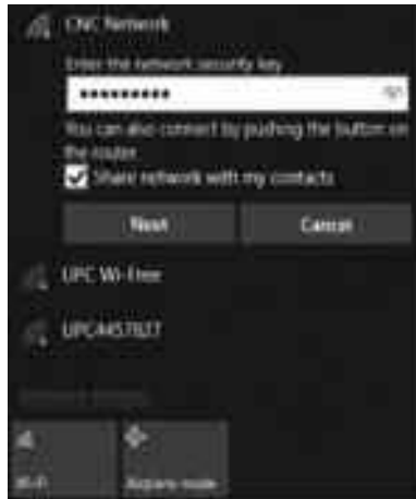
অন্যদের সাথে সংযুক্ত নেটওয়ার্ক শেয়ার করা হচ্ছে

যদি সম্প্রচার রাউটার WPS সমর্থন করে এবং এই বৈশিষ্ট্য সক্রিয় করা হলে আপনার রাউটারের WPS বোতামে চাপ দিয়ে সংযোগ স্থাপন করতে পারেন। এ ছাড়া উইন্ডোজ ১০ 'Share the network with my contacts' নামে একটি অপশন প্রদান করে। এই বৈশিষ্ট্যটি 'Wi-Fi Sense' নামে পরিচিত, যা আপনি যে নেটওয়ার্কে সংযুক্ত তা অন্যদের শেয়ার করার সুযোগ দেয়। ওয়াইফাই সেন্স নেটওয়ার্ক শেয়ার করে, কিন্তু এটি করে নিরাপদভাবে। এটি নেটওয়ার্ক পরিচয় অন্য ইউজারের কাছে প্রকাশ করে না।