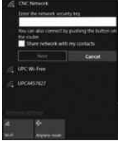
সংযোগের আগে নেটওয়ার্কের সিকিউরিটি কী এন্ট্রি দিতে হবে

সেটিং স্ক্যান করবে, তারপর নেটওয়ার্কের নিরাপত্তা কী'র জন্য অনুরোধ জানাবে।