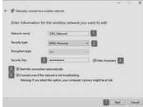
লুকানো বা প্রচ্ছন্ন ওয়্যারলেস নেটওয়ার্কে যুক্ত হওয়ার জন্য প্রয়োজনীয় তথ্য এন্ট্রি দেয়া হচ্ছে

এবার ওপেন নেটওয়ার্ক ও শেয়ারিং সেন্টারের ভেতরে Set up a new connection or network-এ ক্লিক করুন বা টাচস্ক্রিনে টোকা দিন। এ পর্যায়ে Manually connect to a wireless network সিলেক্ট করে Next-এ ক্লিক করুন।