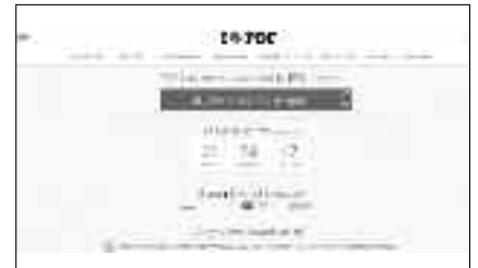
আই লাভ ইউ

ক্রোমবুক ব্যবহারকারীদের হতাশ হওয়ার কোনো কারণ নেই, কেননা ক্রোম ওএস অপারেটিং সিস্টেম তার ব্যবহারকারীদের জন্য সম্পূর্ণ করে বেশ কিছু অপশন। এ অপশনগুলো অন্যান্য অপারেটিং সিস্টেমের তুলনায় কিছুটা কষ্টকর বা অস্বাভাবিক হলেও ব্যবহারের জন্য