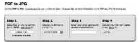
পিডিএফ থেকে জেপিজি ফরম্যাটে কনভার্ট করা

নির্দিষ্ট ফরম্যাটে কনভার্ট করবে। উদাহরণস্বরূপ, পিডিএফ থেকে জেপিজি ফরম্যাটে।