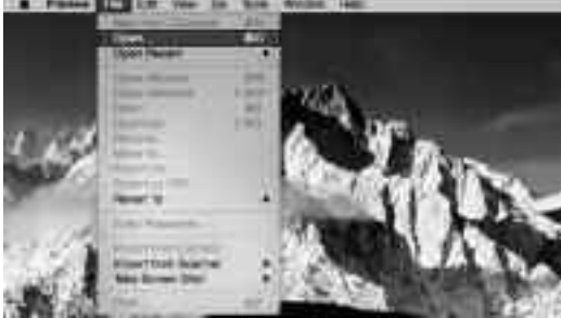
আপলের প্রিভিউ অপশন

প্রিভিউ : প্রিভিউয়ে একটি পিডিএফ ফাইল ওপেন করুন। বেশিরভাগ ক্ষেত্রে পিডিএফ স্বয়ংক্রিয়ভাবে ওপেন হয় প্রিভিউয়ে, যতক্ষণ পর্যন্ত না এ কাজের জন্য আরেকটি প্রোগ্রাম বেছে নিচ্ছেন। আপনার পিডিএফ ফাইলকে হয়তো খুঁজে দেখতে হতে পারে। এজন্য এতে ডান ক্লিক করে প্রিভিউয়ে ওপেন করুন যদি প্রয়োজন হয়।