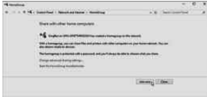
হোমগ্রুপে যোগদানের জন্য Join Now বাটনে ক্লিক করা হচ্ছে

নেটওয়ার্ক, সম্ভবত কোনো একটি কফি শপে আপনি অবস্থান করছেন। স্বাভাবিকভাবেই উইন্ডোজ ধরে নেয়, আপনি আপনার কমপিউটারের মাধ্যমে অন্য কাউকে অ্যাক্সেস দিতে চান না। তাই এটি আপনার পিসিকে 'undiscoverable' অবস্থায় রেখে দেবে। এর অর্থ, কেউ নেটওয়ার্কে আপনার কমপিউটার খুঁজে পাবে না এবং আপনিও অন্য কারও কমপিউটার খুঁজে পেতে সক্ষম হবেন না। Yes নির্বাচন করা হলে যা এখানে দেখানো হয়েছে, এটি উইন্ডোজকে জানাবে যে, আপনি একটি প্রাইভেট বা ব্যক্তিগত নেটওয়ার্কে রয়েছেন, যেখানে ফাইল ও প্রিন্টার শেয়ার করতে সক্ষম হবেন।