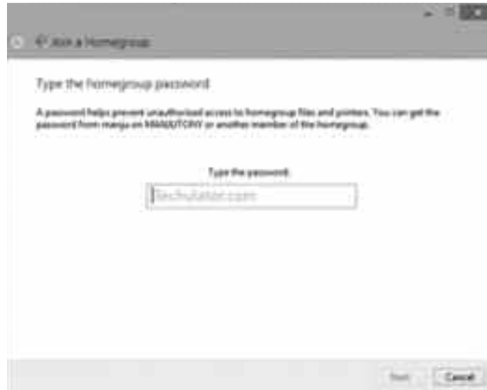
হোমগ্রুপ পাসওয়ার্ড সেটআপ