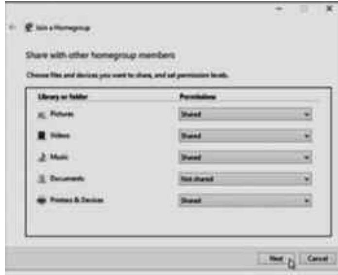
একটি Homegroup-এর আওতায় বিভিন্ন আইটেম শেয়ার করার উইন্ডো

• নেটওয়ার্কভুক্ত প্রতিটি কমপিউটারকে Homegroup-এর মধ্যে অন্তর্ভুক্ত করতে হলে ওই একই পাসওয়ার্ড ব্যবহার করতে হবে। আপনার কমপিউটার চালু রাখুন এবং যে Homegroup তৈরি করেছেন, তাতে যোগদানের জন্য নেটওয়ার্কের অন্য কমপিউটারে এ ধাপগুলো অনুসরণ করুন।