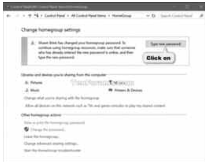
হোমগ্রুপ সেটিং পরিবর্তন

• আপনি ওপরের পদক্ষেপগুলো অনুসরণ করে Homegroup তৈরি করেছেন বা এতে যুক্ত হয়েছেন। এই শেয়ার করা হোমগ্রুপ নেটওয়ার্কের যেকোনো উইন্ডোজ ৮.১, ৮ বা ৭ চালিত কমপিউটার থেকে প্রবেশযোগ্য বা অ্যাক্সেসেবল। এ ছাড়া আপনার কমপিউটারকে এমনভাবে সেটআপ করেছেন, যাতে এর থেকে সঙ্গীত, ফটো ও ভিডিও ফোল্ডার অন্যদের সাথে শেয়ার করা যায়। মনে রাখতে হবে, Homegroup আইপ্যাড বা স্মার্টফোনের সাথে ফোল্ডার শেয়ার করার অনুমতি দেয় না। ওই ডিভাইসের মধ্যে ফাইল শেয়ার করার জন্য তাদের ওয়ানড্রাইভ অ্যাপ্লিকেশন ডাউনলোড করতে হবে।